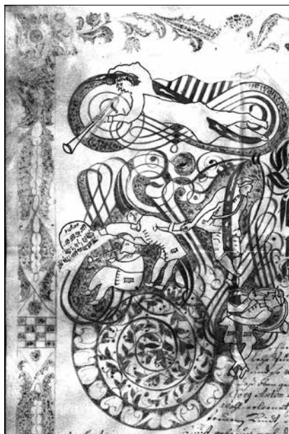
Ein Schmuckornament aus der Urkunde

Aus diesen Aufzeichnungen geht mit keinem Wort hervor, dass er nicht nur als Türmer, sondern auch als „bestellter Musicus instrumentalis “ seinen Dienst versah. Erst die ausgezeichnete und hervorragend gestaltete Urkunde lässt erkennen, welch hohen Rang er als Türmer inne hatte.