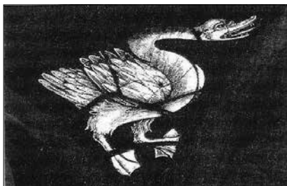
Das „ Drachfenster “ im „ Roten Haus “, Mainz