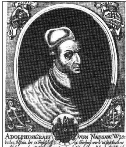
Erzbischof Adolf II., Graf von Nassau-Wiesbaden-Idstein, geboren um 1423, gestorben am 6. September 1475

Was aber war der Anlass zu diesem rohen und kämpferischen Vorgehen? In der sog. Mainzer Stiftsfehde (1459 bis 1462) stritten zwei Mainzer Erzbischöfe, Diether von Isenburg-Büdingen (geboren um 1412, gestorben am 6. Mai 1482) und Adolf II., Graf von Nassau-Wiesbaden-Idstein (geboren um 1423, gestorben am 6. September 1475) um den Erzbischofsthron.