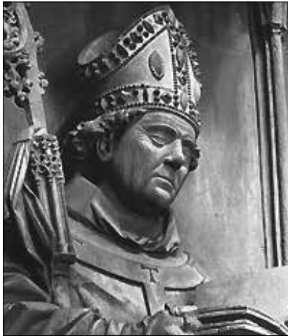
Erzbischof Diether von Isenburg-Büdingen, geboren um 1412, gestorben am 6. Mai 1482